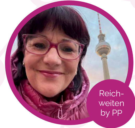
Reich- weiten by PP