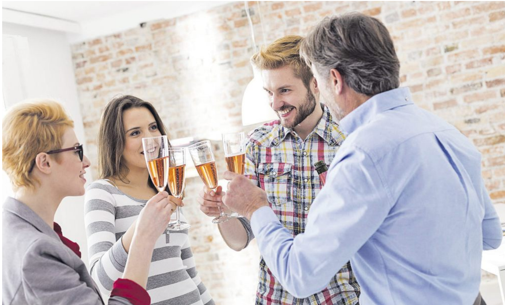
In ungezwungenem Rahmen lässt sich manchmal der beste Grundstein für ein gutes Netzwerk legen.

Zuerst muss sich jeder fragen, was er mit dem Networking erreichen möchte. Nur Kontakte zu knüpfen, um persönlich weiter zu kommen, wird nicht funktionieren. Networking ist keine Einbahnstraße. Das muss jedem klar sein. Die Netzwerkstrategie ist somit von jedem einzelnen abhängig, denn wer weiß,